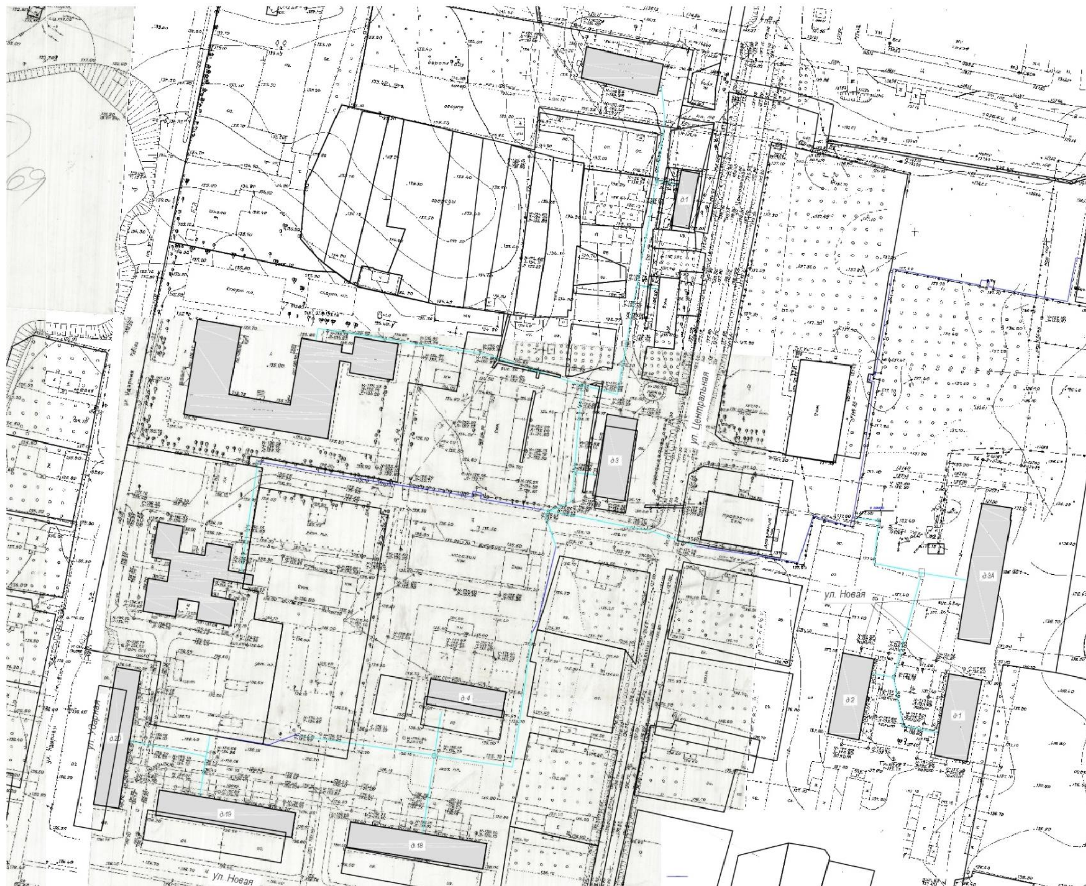
Схема № 1. Схема системы теплоснабжения с. Дмитрова Гора